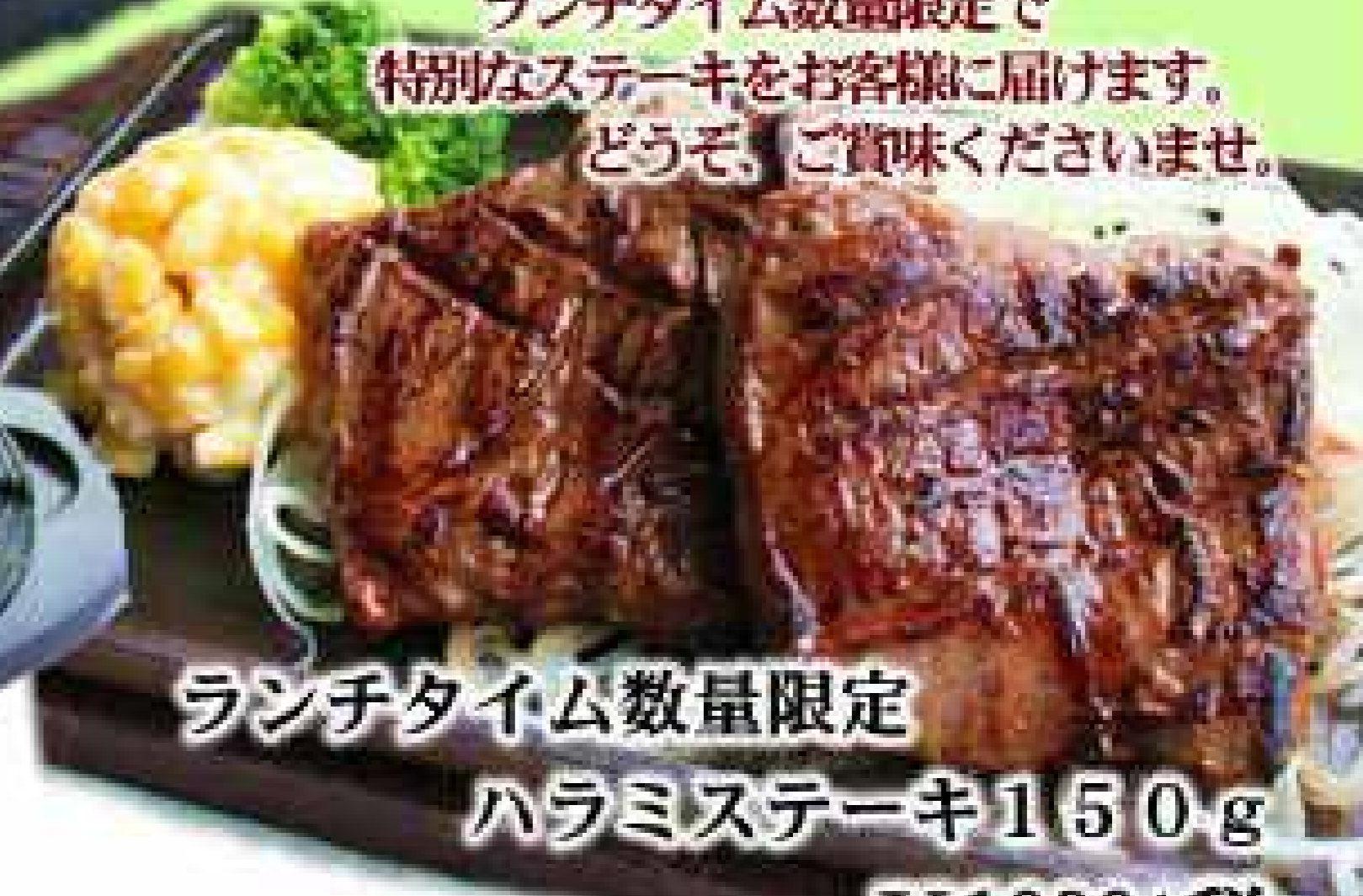
ランチタイム数量限定 ハラミステーキ150g ¥1000+税