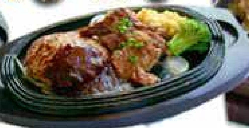
ハンバーグ&カットステーキ ¥980+税