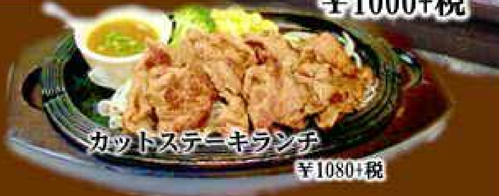
カットステーキランチ ¥1080+税