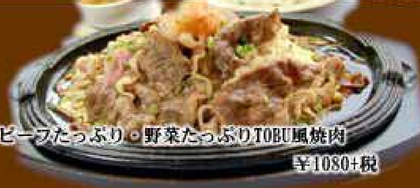
ビーフたっぷり・野菜たっぷりTOBU風焼肉 ¥1080+税