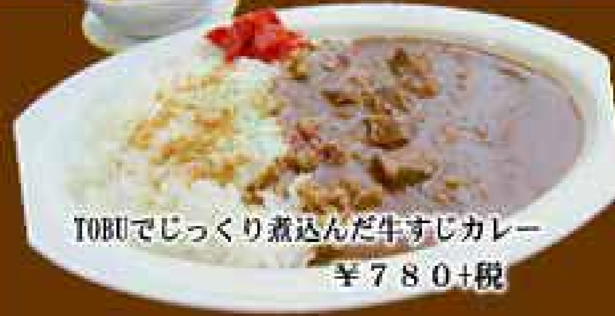
TOBUでじっくり煮込んだ牛すじカレー ¥780+税