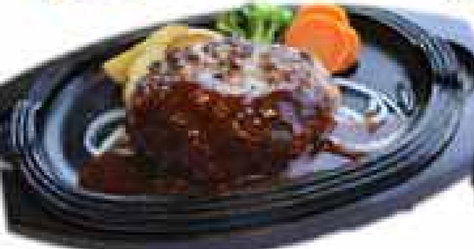
ハンバーグ180gランチ ¥880+税