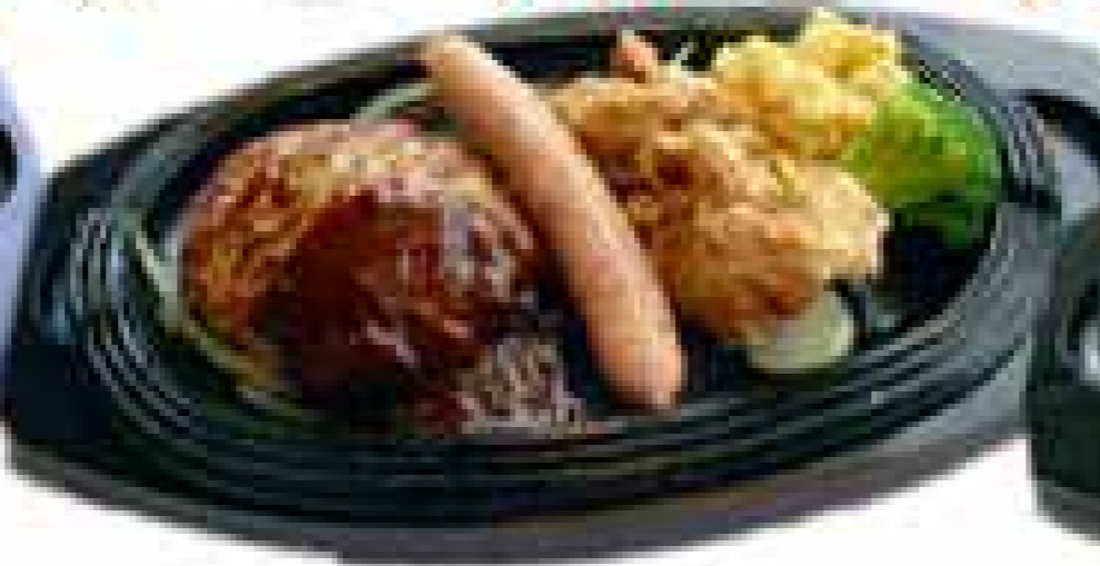
ハンバーグ&ミックスランチ ¥900+税